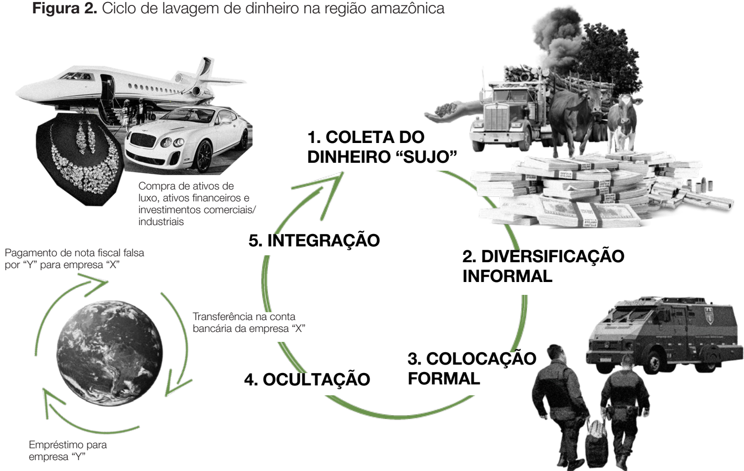
Figura 2. Ciclo de lavagem de dinheiro na região amazônica

De um modo geral, o ciclo da lavagem de dinheiro segue três etapas até que os recursos lavados possam seguir para o sistema financeiro: inserção, ocultação e integração. 15 No entanto, são necessárias cinco etapas para que possamos compreender o contexto amazônico de forma adequada: coleta do dinheiro a ser lavado, diversificação informal, inserção formal, ocultação e integração (Figura 2).